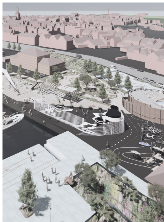
Der er afsat kommunale midler i 2025-26 til en ny Geobavnepark mellem Jessens Mole og Nordre Kaj.

Endelig vil Kommuneplanen, der formelt fastlægger rammerne for anvendelse af områderne, herunder rækkefølge for boligudbygning, blive revideres hvert 4. år.